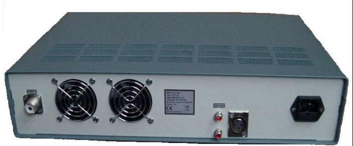
Twin Master serie