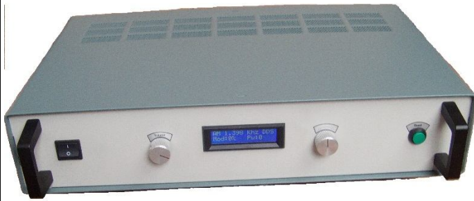
Twin Master serie