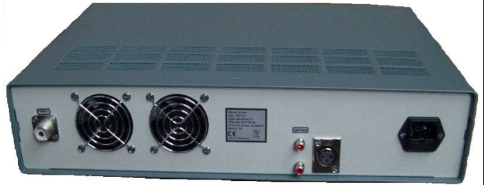
Twin Master serie